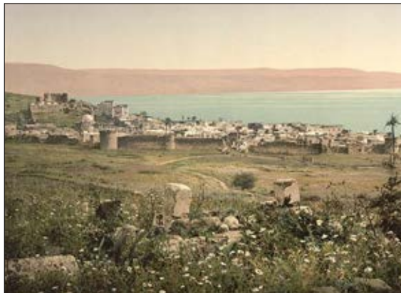
ארצנו ונחלתנו. עיר הקודש טבריה בצילום מלפני מאה וחמישים שנה

יש חששים איננוחות לנוכח טיעונים המבוססים על אמונה ועל התנ"ך. הללו נראים בעיניהם כביכול תלושים מהשפה הדיפלומטית. אבל זו