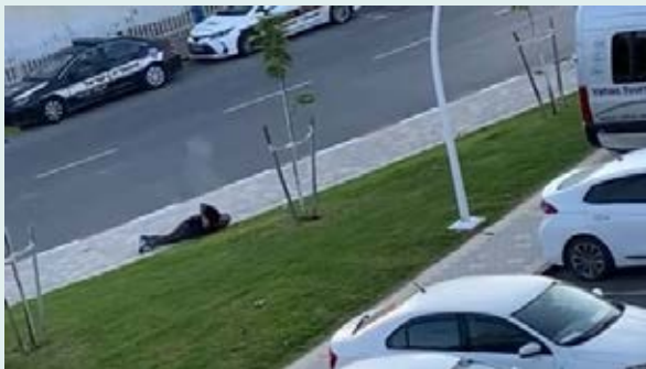
"התחלתי לזחול. חטפתי שני כדורים במותן ואחד בחזה"