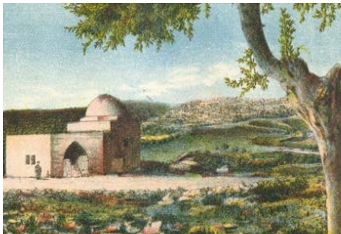
הוצאת יצחק חגיז. גלויה של קבר רחל

נוסף על שותפותו בחנות שניהל עם גיסו ר' יחיאל עסק ביבוא נייר ומוצרי כתיבה, והקים את